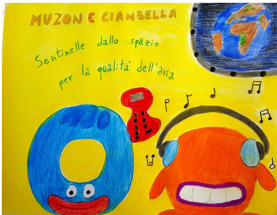
Gli alunni della classe 2^F

Consiglierei questa esperienza a tutti gli alunni perché è stato un bel lavoro di gruppo, che abbiamo potuto fare anche in didattica a distanza. Inoltre è servito molto per riflettere sulle condizioni del nostro pianeta e per cercare delle possibili soluzioni per contrastare il fenomeno dell'inquinamento e per far tornare a sorridere anche la Terra.